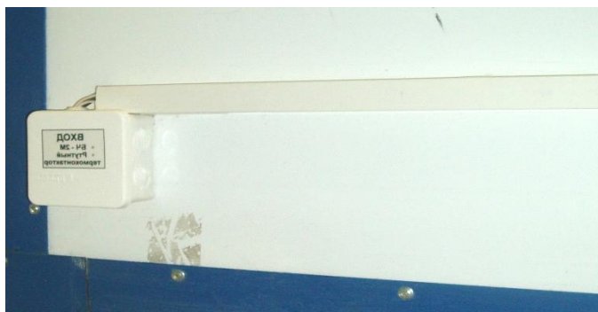
Рисунок 13 – Установка распределительной коробки

Перед обработкой камеры водой крышку датчика обязательно плотно закрыть.